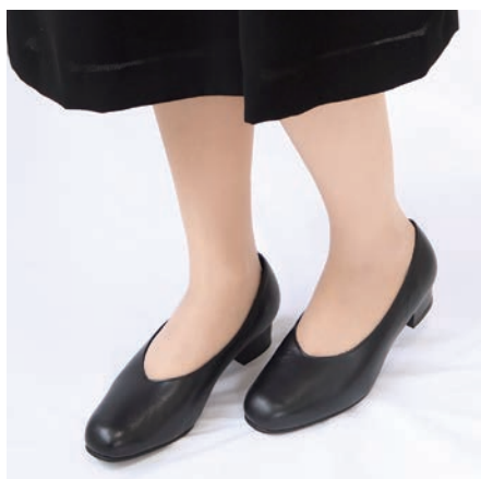
プレーンタイプ 「プレミアムパンプス」 18,700円(税込)

内側も黒で統一することでフォーマルシーンにも使用しやすい、シンプルなデザインになっております。