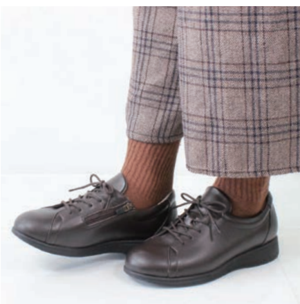
レザースニーカー 「パレルモ」 24,200円(税込)

内側も黒で統一することでフォーマルシーンにも使用しやすい、シンプルなデザインになっております。