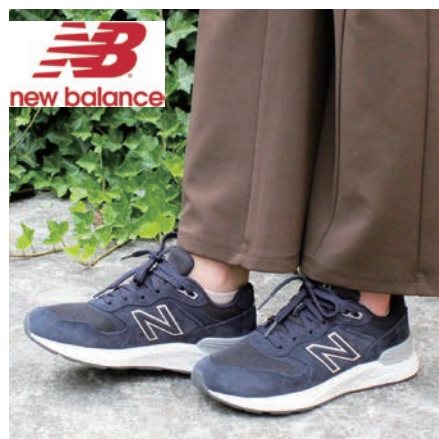
ニューバランス 「WW880」 13,970円(税込)

安定感のあるソールとしっかりとしたヒールカウンターが足のブレを押さえ、快適な歩行をサポートします。