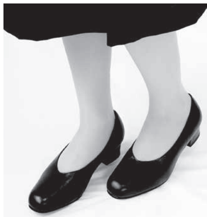
プレミアムパンプス

すっきりと見えるバックベルトタイプのサンダル。つま先と甲の幅を面ファスナーで調整できるから左右差のある足などにもフィットさせやすく歩きやすさも◎