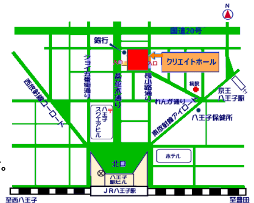
クリエイトホール地図